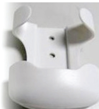
Держатель для пульта настенный